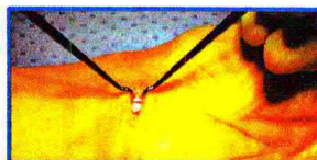
Technique par vidéo-chirurgie Incision de 0,5 cm à 1,5 cm

d'où l'abandon de la technique ouverte au profit de la technique par vidéo-chirurgie