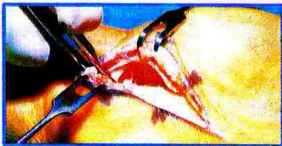
Technique ouverte Incision de 1,5 cm à 4 cm